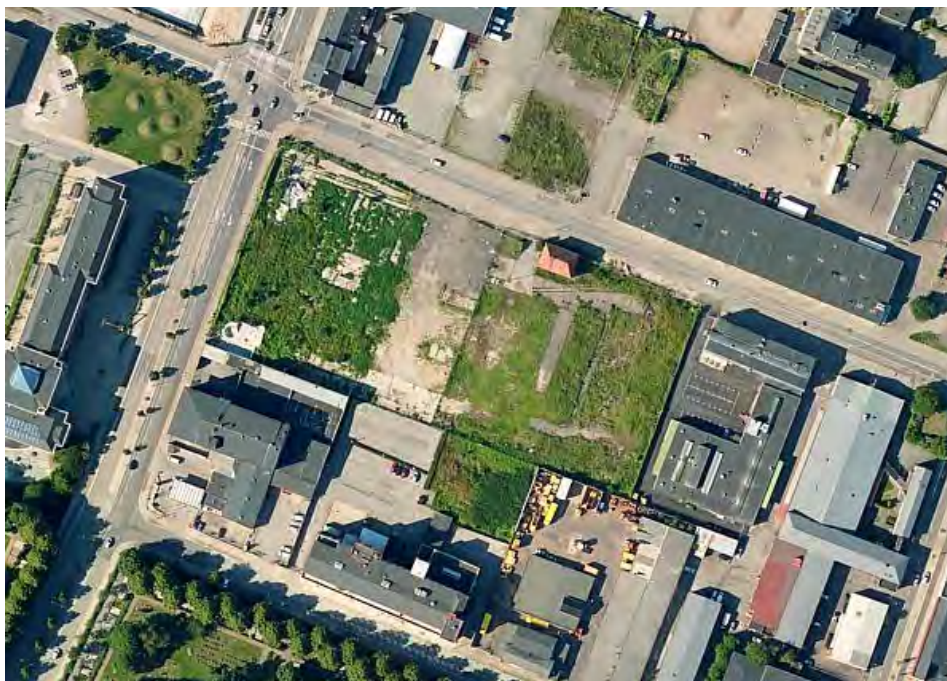
Platsbesök I: Ödetomten på Industrigatan

Dagen började med att gruppen samlades vid Fastighets- och gatukontoret i Malmö. Därifrån startade vi förmiddagens cykeltur genom Malmö under vilken vi gemensamt besökte och diskuterade fem olika platser som alla på något vis knöt an till temat temporär gestaltning. Platserna var till sin karaktär olika, det gemensamma var att någon typ av aktivitet eller intiativ uppstått till följd av att platsen blivit ett glapp (tillfälligt tillgänglig), antingen från kommunens eller en annan intiativtagares håll eller självsanktionerat/aktivism.