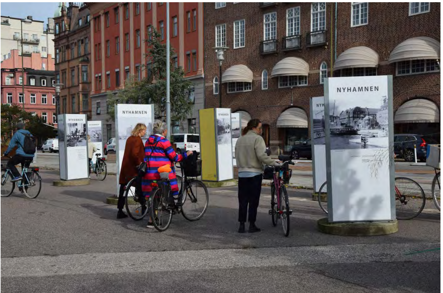
Gruppen ser sig omkring i utsällningen om Nyhamnen.