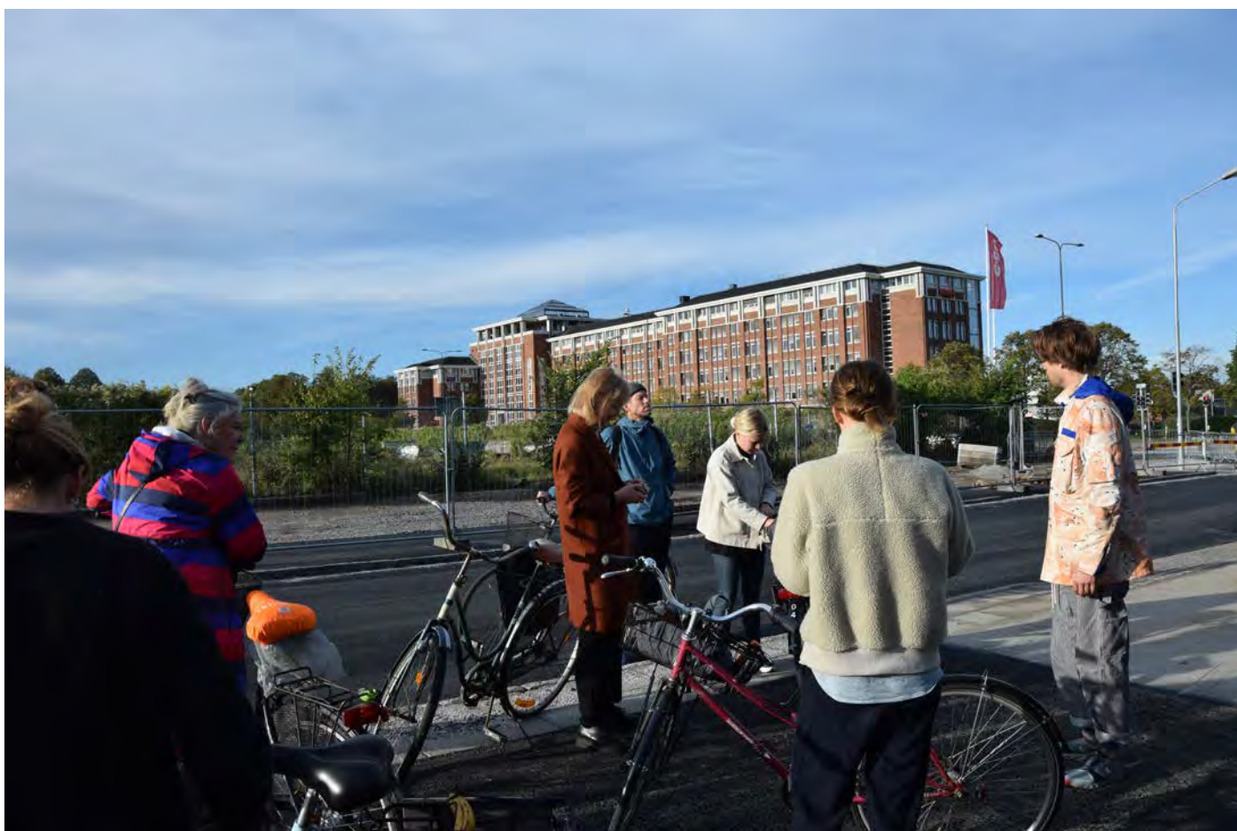
Gruppen samlas vid ödetomten som är cykelturens första stopp.