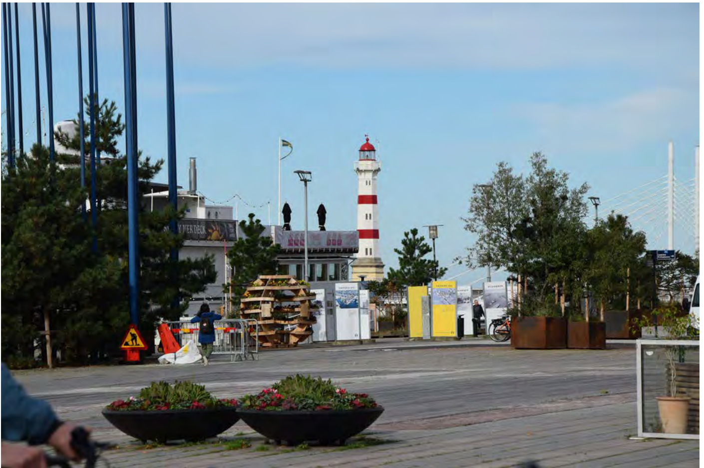
Utsikt över där Smörkajen börjar, sett från Posthusplatsen. På bilden syns blomsterplanteringen av plywood gjord av studenter vid Malmö Universitet, skyltar med utställning om Nyhamnen samt träden i urnor.