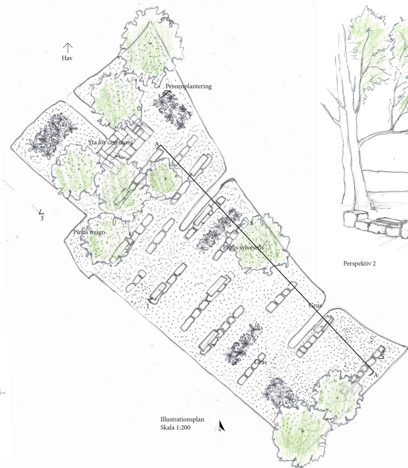
Illustrationsplan Skala 1:200