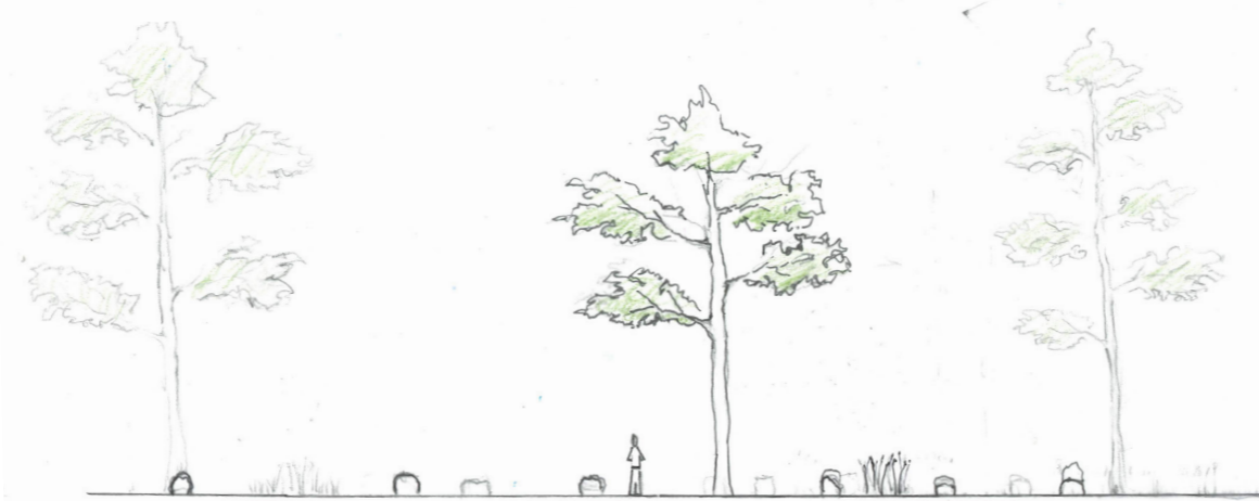
Sektion A-A Skala 1:200

Den nuvarande växtligheten på platsen består av tall som kommer behållas men två nya tallar planteras, dels för att skärma av platsen samt utöka dess krontak. Intill kapellet placeras en Pinus Mugo som skärmar av ytan för ceremoni från ingången till kapellet och i mitten av platsen placeras en Pinus Sylvestris. Utspritt i förslaget planteras perenner i strikta geometriska rader. Planteringarna består av en blandning av olika perenner som både blommar under tidig vår och sen höst för att platsen ska erhålla ett högt estetisk värde en stor del av året. Exempel på perenner i förslaget är lavendel, blå bolltistel samt dagdkåpa. Förutom ytan för ceremonier består i stort sätt resten av ytan av gräs förutom två stigar av grus som leder in från den befintliga grusstigen på norra sidan av platsen. Detta för att underlätta för personer med rullator etc att kunna delta på ceremonier.