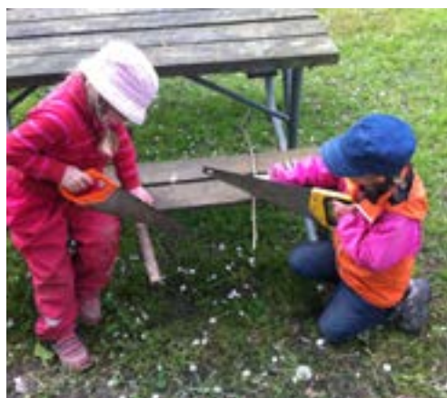
Spännande att prova riktiga verktyg.

Kanske ska denna oro istället rikta sig mot att barn i staden idag förlorar möjligheterna att utveckla sin fysik, sin kroppsmedvetenhet, sitt självförtroende och omdöme.