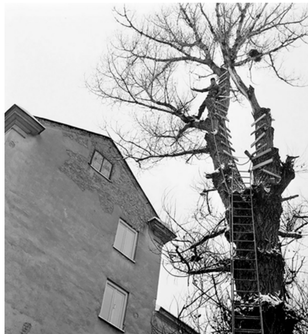
Hemmabygda trappsteg på ett klätterträd skapar spänning för modiga.

Denna utveckling är generell över hela västvärlden och beror till stor del på den ökade biltrafiken, brist på säkra gång- och cykelvägar och föräldrars upplevda oro. Detta gör att närmiljön vid hem, skola och förskola blir mycket betydelsefulla utemiljöer för barn och unga.