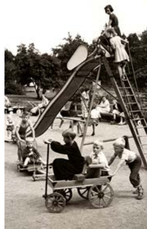
För 50-talets hemmafruar var lekplatsen en viktig mötesplats.

På kommande sidor visas hur familjepolitik, stadsplaneideal och lekplatser påverkat planering och utformning av lekplatser under de senaste 150 åren.