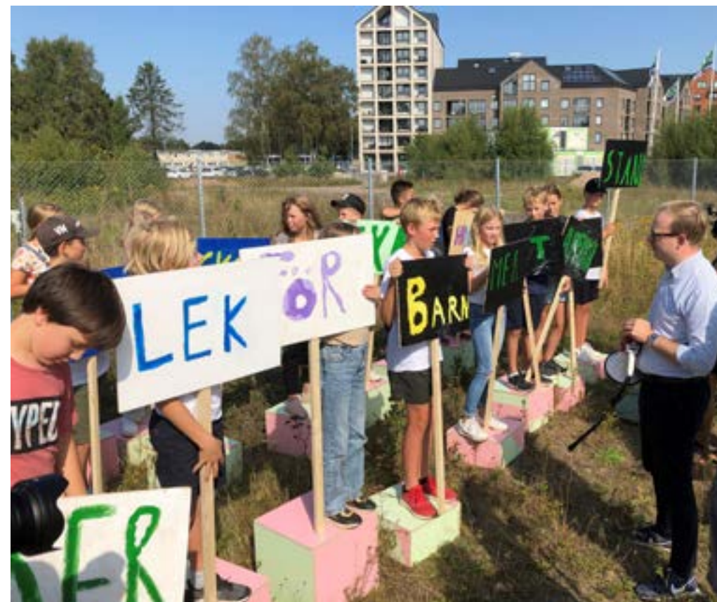
Barn i Ängelholm samtalar med kommunstyrelsens ordförande om ett nytt stadshus i staden.

Barnen beskriver hur det pirrar i magen när de med lite skräckblandad förtjusning antar fysiska utmaningar och provar sitt mod i relation till vuxna och kompisar. Även de enklaste formerna av kojbygge är en viktig aktivitet för att barn ska kunna börja ta plats i världen, visar forskaren Maria Kylin, SLU, i sina studier.