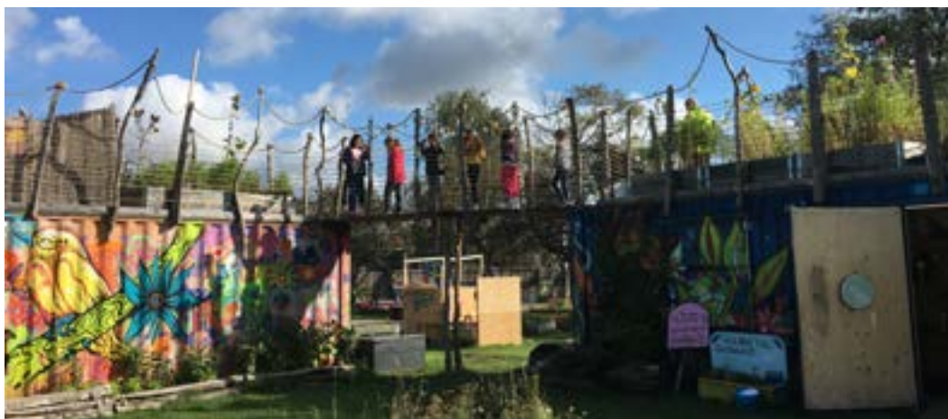
Vuxna kan göra det möjligt för barn att uttrycka sig genom kreativitet. Guldängens bygglek, Malmö.

Nyckelegenskaperna i lek är nöje, osäkerhet, utmaning, flexibilitet och icke-produktivitet. Tillsammans bidrar dessa faktorer till njutningen i leken och därmed till motivationen att fortsätta leka. Lek anses ofta inte vara nödvändig, men kommittén framhåller återigen att det är en grundläggande och livsviktig dimension av barndomens nöje, samt en avgörande del av den fysiska, sociala, kognitiva, emotionella och andliga utvecklingen.