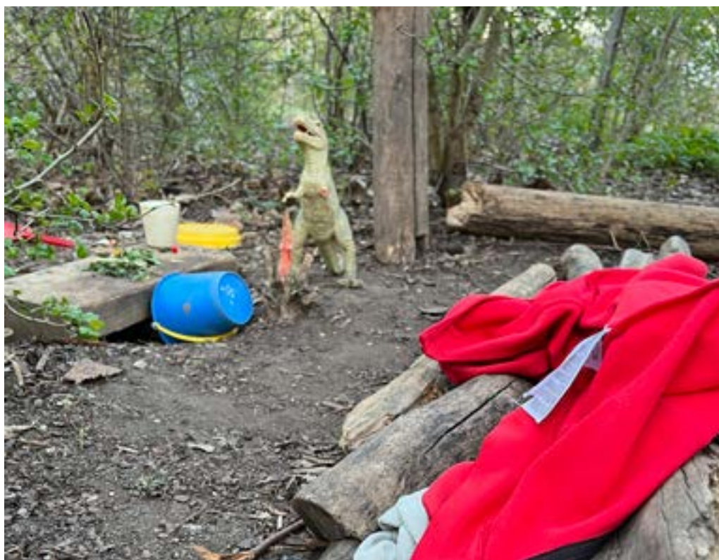
Barns lek försiggår överallt och behöver inga påkostade lekredskap.

Vi behöver därför också förstå och planera för vår egna lekfulla natur.